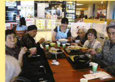
みんなで外食は 楽しいね