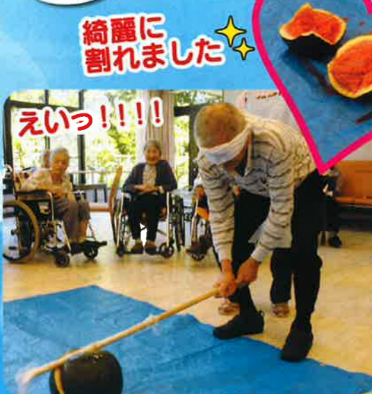
綺麗に 割れました