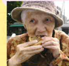
なつかしい味だわ