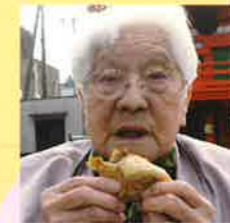
さのやのきんつば